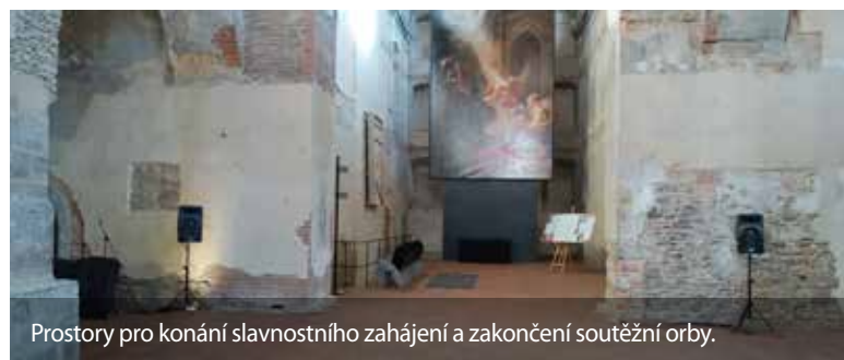
Prostory pro konání slavnostního zahájení a zakončení soutěžní orby.

soutěži v orbě historickou technikou. I tato soutěž má svá pravidla a jsou stanoveny podmínky s jak starými traktory i pluhy se smí soutěžit a letos se měl konat již X. ročník těchto „veteránů“. V neposlední řadě musíme zmínit i orbu koňmi. Bohužel zde se potýkáme s generačními problémy. Koní je v České republice sice dost, jejich početní stavy potěšitelně stoupají, ale je jen málo zemědělců a soukromě hospodařících rolníků, kteří orbou s koňmi zvládnou. Složitá situace s Covidem - 19, která nastala v České republice počátkem září však hluboce zasáhla do práce Společnosti pro orbu a zhruba týden před konáním vlastní soutěže se Výbor Společnosti rozhodl i tyto soutěže zrušit. Velká škoda. Nejsme bohužel jediní, které postihlo již sto procentně připravenou akci zrušit včetně např. již vytištěných katalogů, startovních listin a řady dalšího. To, že akce byla připravena dokladuje níže fotografie z konání tiskové konference v Opavě dne 1.9.2020. Práce Výboru Společnosti pro orbu ČR, z.s. ovšem zrušením konání této soutěže neskončila. Již v době intenzivních příprav Středoevropské orby v Opavě byla obnovena jednání o konání soutěží v roce 2021. Již dnes je rozhodnuto, že krajské soutěže se uskuteční