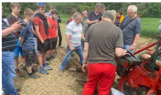
Skupina budoucích oráčů bedlivě sleduje odborný výklad zkušených lektorů při debatě o seřizování soutěžního pluhu.