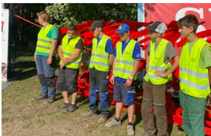
Účastníci 1. ročníku sportovní orby středních škol po vylosování soutěžních parcel, těsně před odchodem ke svým traktorům a odjezdu k parcelám.

U této nově vzniklé soutěže bylo důležité se zúčastnit, zabojevat o výsledek, ale také odnést si sebou kvalitní ceny za umístění. O toto se mimo jiné postarala i společnost RENOMIA AGRO, která je specializovaným oddělením společnosti Renomia, a.s. a věnovala ceny Galaxy TAB a sekerky a nože od společnosti Fiskars. Účastníci této soutěže si odnesli i mnoho dalších cen.