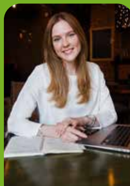
EKONOMIKA A PODNIKÁNÍ