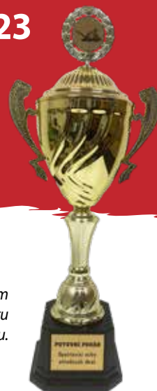
Putovní pohár věnovaný poslancem a místopředsedou Zemědělského výboru PS PČR, Ing. Karlem Smetanou.

Tato myšlenka se zrodila přibližně před rokem, kdy společnost OPaLL-AGRI, s.r.o. z Dolních Životic přišla s nápadem udělat akci pro studenty zemědělských oborů na středních školách v České republice. Snahou bylo dát prostor mladé generaci porovnat si své dovednosti a vzbudit zájem o orbu, která je krásnou disciplínou a také jednou z mála půdozpracujících operací, jejíž výsledky lze subjektivně i objektivně hodnotit a jejíž výsledek ovlivňuje přímo osoba závodníka. Zájem zemědělských středních škol takovouto soutěž pro mladé zorganizovat byl a nastalo dilema kde. Padaly návrhy na různé lokality. Nakonec zvítězila nabídka od Dostihového spolku Pardubice, aby se 1. ročník sportovní orby uskutečnil na místním závodišti a rozšířil tak program organizovaný u příležitosti jubilejního XXV. ročníku výstavy Koně v akci a tradičních dožíněk Pardubického okresu.