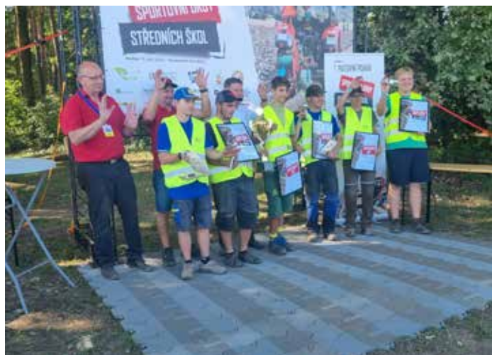
Závěrečný pozdrav všech soutěžících.