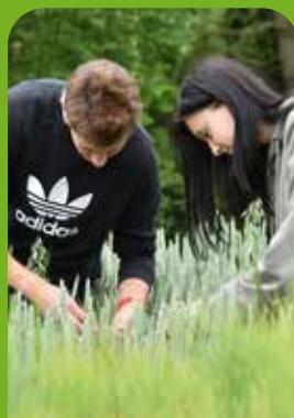
AGROPODNIKÁNÍ ZEMĚDĚLSKÝ PROVOZ