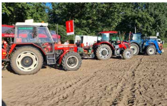
Soutěžní posádky a jejich traktory těsně před zahájením soutěže.