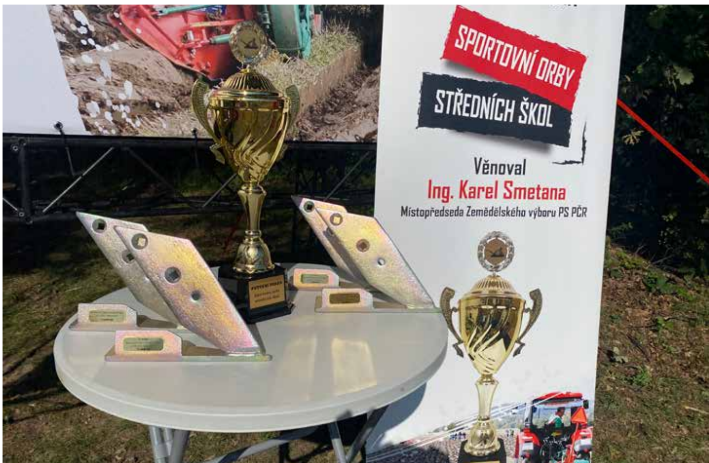
Originální ceny vytvořené společností OPaLL-AGRI, s.r.o., budou zdobit vitríny vítězů 1. ročníku sportovní orby středních škol. Jejich originalita bude tento ročník pravidelně připomínat.