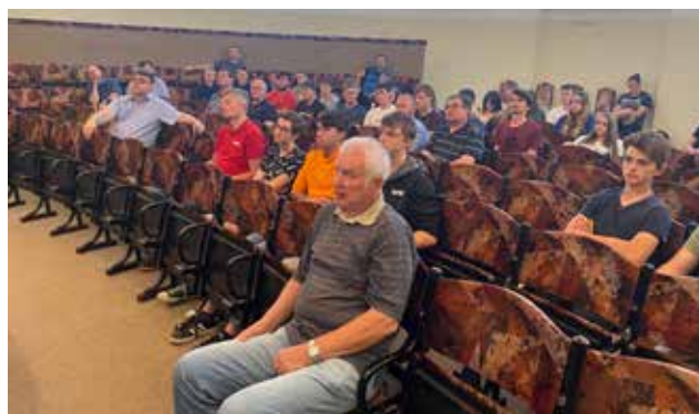
Zaplněná hala auly Zemědělské školy v Čáslavi při semináři k 1. ročníku sportovní orby středních škol ze dne 30.5.2023.

Soutěž probíhala na závodní oranici Pardubického dostihového závodiště nedaleko Taxisova příkopu a lrské lavice, proslulých překážek Velké pardubické steeplechase a soutěžilo se s jednostrannými i otočnými dvouradličnými pluhy. Pro všechny přítomné bylo radostí sledovat s jakým elánem a nadšením se mladí závodníci pustili do soutěžní orby. Pro organizátory je to signál, že počáteční myšlenka byla správná a nastavená cesta bude mít budoucnost. Další v pořadí 2. ročník v roce 2024 se uskuteční v režii a na pozemcích v okolí Masarykovy střední školy zemědělské a přírodovědné v Opavě u příležitosti Otických zelných slavností, což je v dané lokalitě významná a divácky hojně navštěvovaná akce.